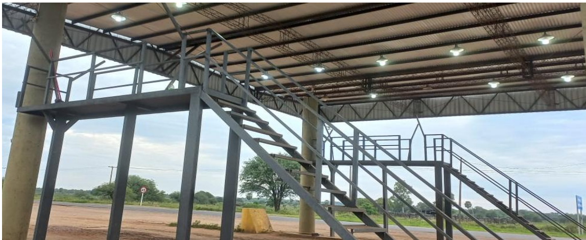
Imagen de referencia para las adecuaciones solicitadas